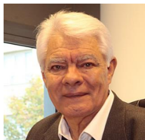
Presidente del IJAN